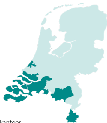
■ Regio's CZ zorgkantoor

U kunt voor zorg terecht bij verschillende instanties: uw zorgverzekeraar, een zorgkantoor of gemeente. Zoekt u ondersteuning of wilt u weten hoe u de zorg kunt regelen voor u zelf of iemand anders? Ga naar: www.cz-zorgkantoor.nl/hulpwijzer-wlz en ontvang een persoonlijk stappenplan en tips.